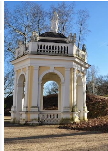
Der „gute Brunnen“ Hanau Wilhelmsbad